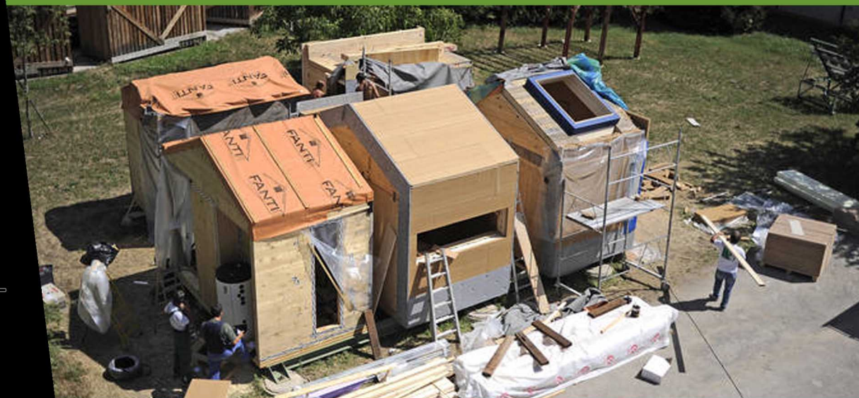
MAI - Modulo abitativo Ivalsa, CNR Trento