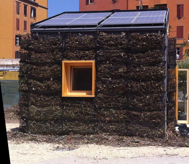
Modulo abitativo per il paesaggio italiano, Denaldi, Roma