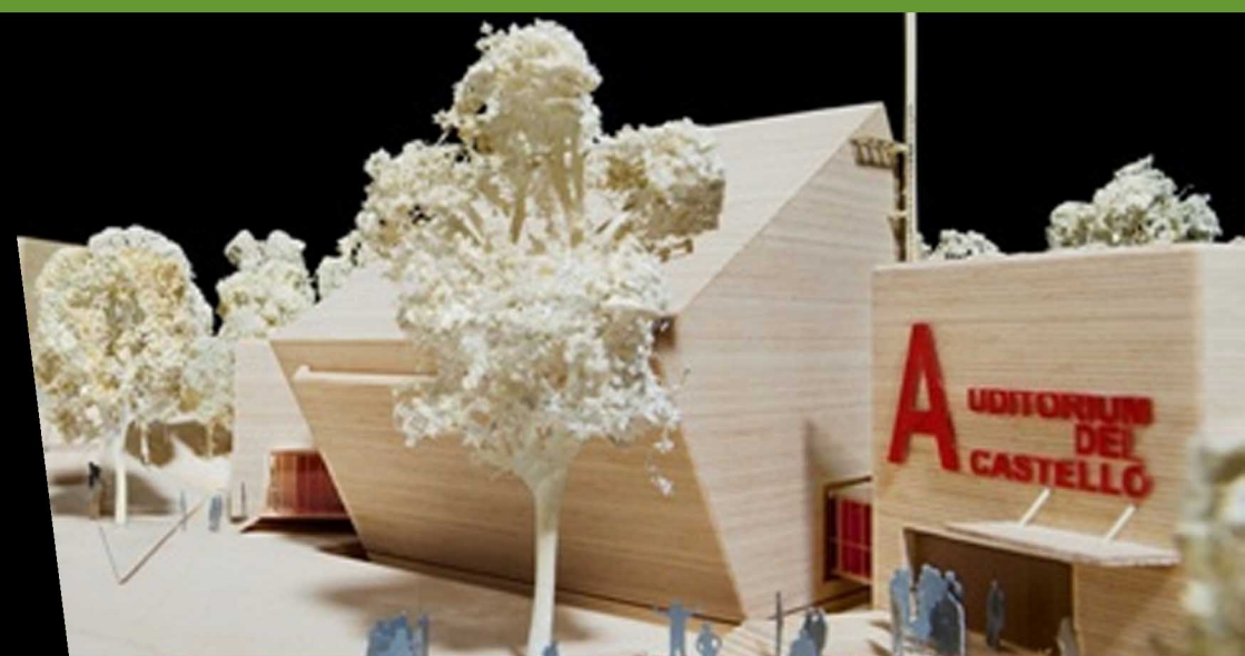
Auditorium all'Aquila - Renzo Piano Building Workshop, LOG Engineering Srl © RPBW

In treno: linea ferroviaria Torino-Bussoleno-Bardonecchia, stazione di Beaulard, 10' a piedi dalla fiera.